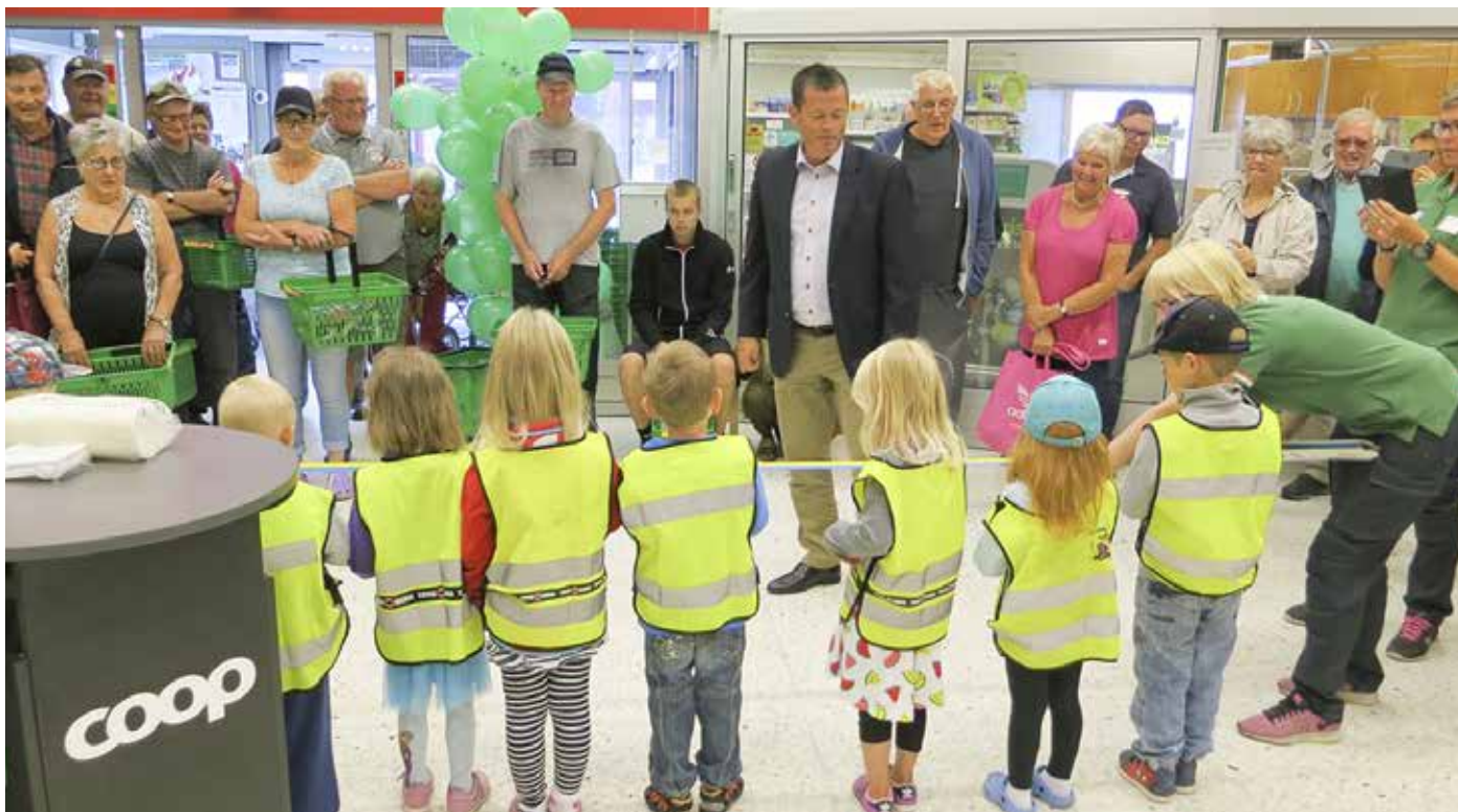
Invigning av Coop Nära Bollstabruk, där framtiden klippte bandet till medlemmarnas nya butik.

Bollstabruk, Bräcke, Vindeln, Sveg, Hörnett i Örnsköldsvik samt Storuman - de pengar vi tjänar investeras i föreningen, i dina butiker. I Umeå och Skellefteå planerar vi för nya butiker. Coop Nord växer.