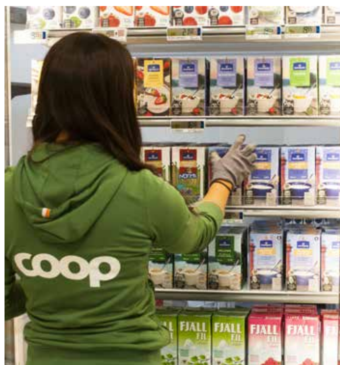
Norrländska varor är viktiga för våra medlemmar.

Varje år skänker Coop Nords medlemmar över en miljon kronor till biståndsorganisationerna Vi-skogen och We Effect.