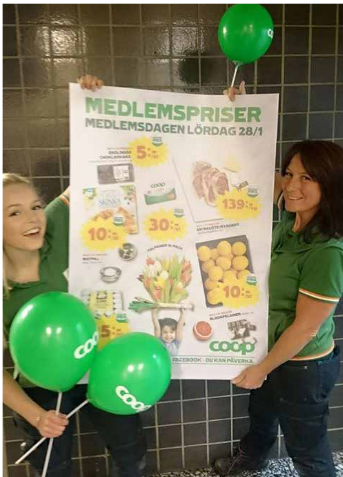
Till medlemsdagen bjöd vi in alla medlemmar för att fika, tala med butikschef och rösta. Här förbereder Coop i Vännäs medlemsdagen.

Du har många förmåner som medlem. Alla dina medlemserbjudanden finns samlade i Medlemspunkten, på coop.se eller i Coop-appen. Fråga i butiken så hjälper vi dig att få ut det bästa värdet av ditt medlemskap.