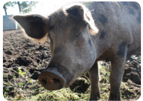
En lycklig eko-gris som får vara ute och böka!

För dig som vill fördjupa dig i hållbarhetsfrågor håller ABF en cirkel, 3x3 tim om eko, Fairtrade m.m. Du anmäler dig till din ABF-avdelning. Mer info får du vid föreläsningen.