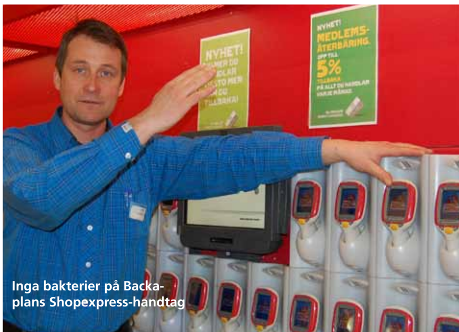
Inga bakterier på Backaplan's Shopexpress-handtag